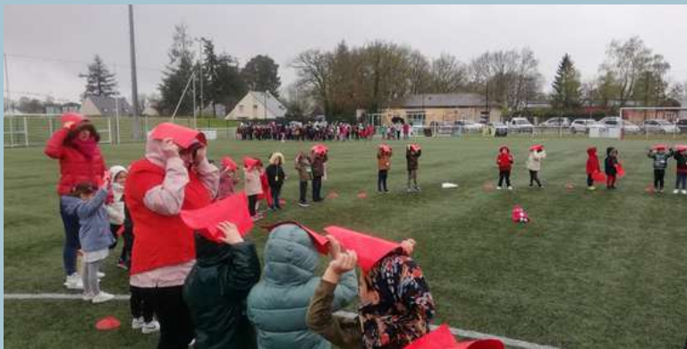
Cérémonie d'ouverture (confection des anneaux pour le drone)