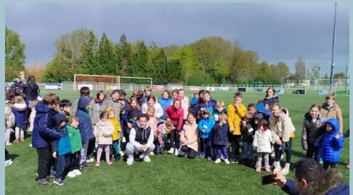
Cérémonie de clôture avec Charles NOAKES