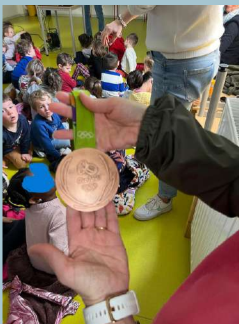
Rencontre avec Guillaume RAINEAU, médaillé olympique en Aviron